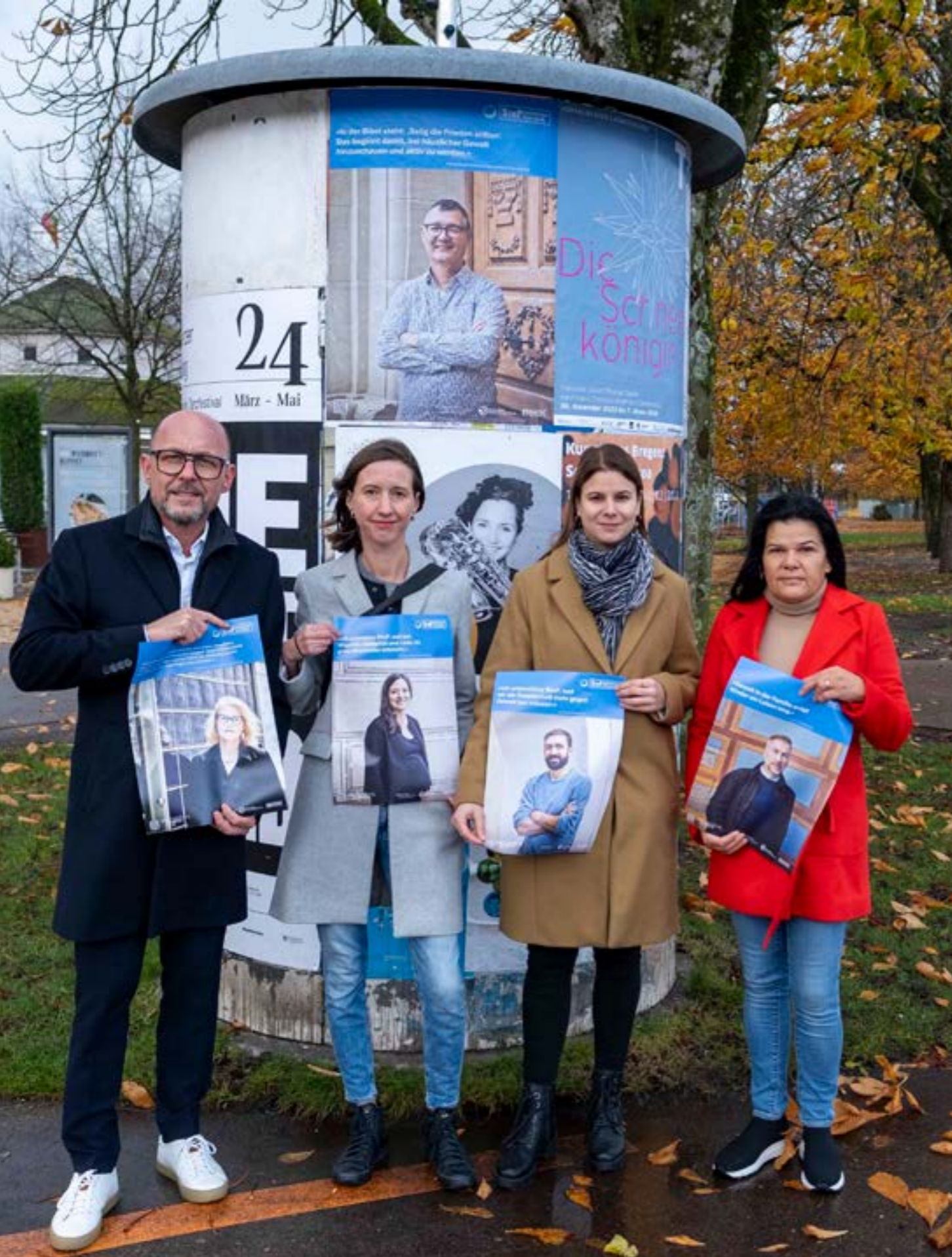
Bregenzer:innen zeigen auf Plakaten öffentlich ihre Unterstützung für das Projekt StoP – Stadtteile ohne Partnergewalt.