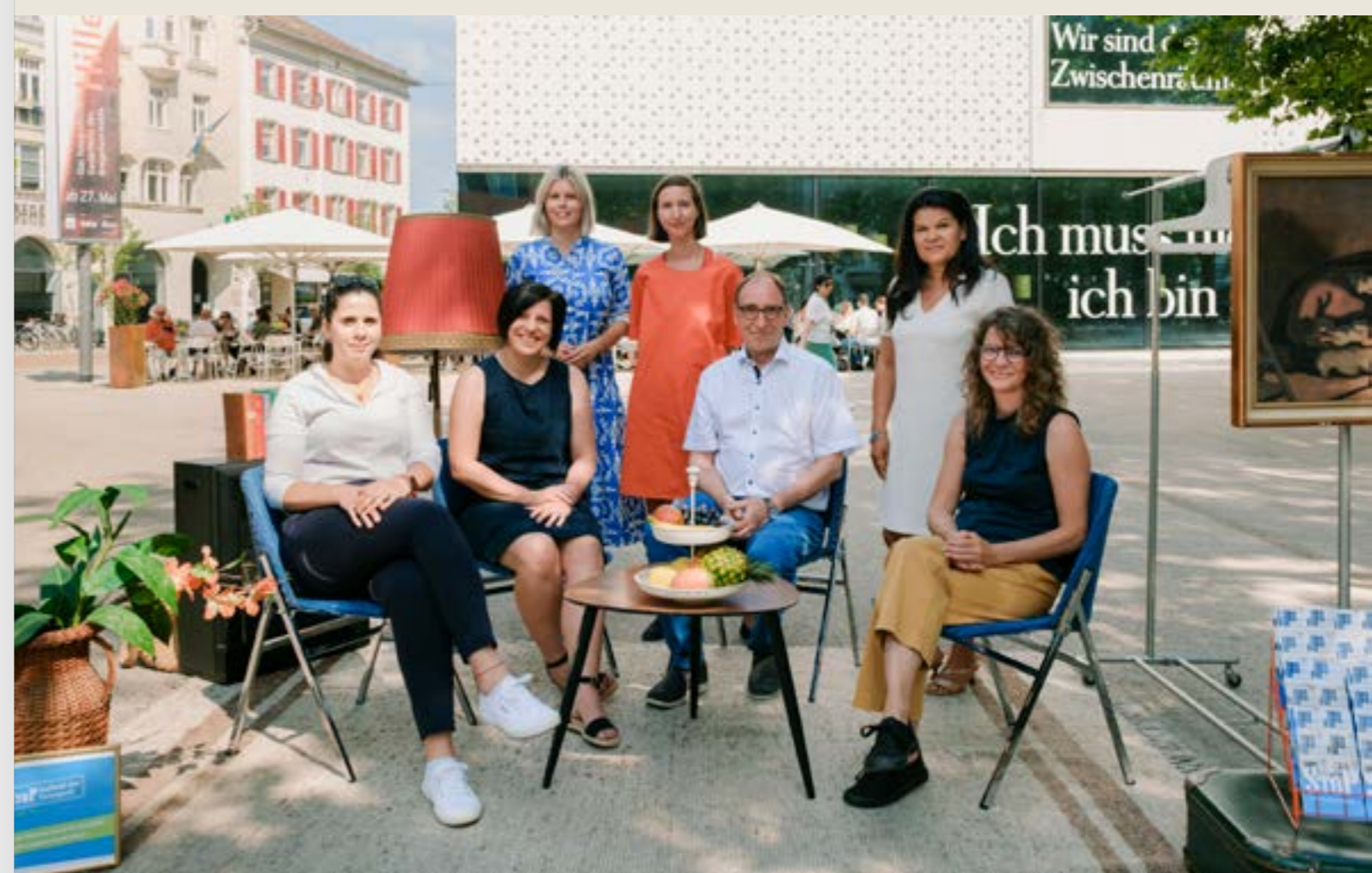
Der StoP-Infostand für Veranstaltungen oder Pressekonferenzen – hier mit Bundesminister Johannes Rauch – ist ein Wohnzimmer, denn Gewalt gegen Frauen passiert oft im privaten Raum, in den eigenen vier Wänden.