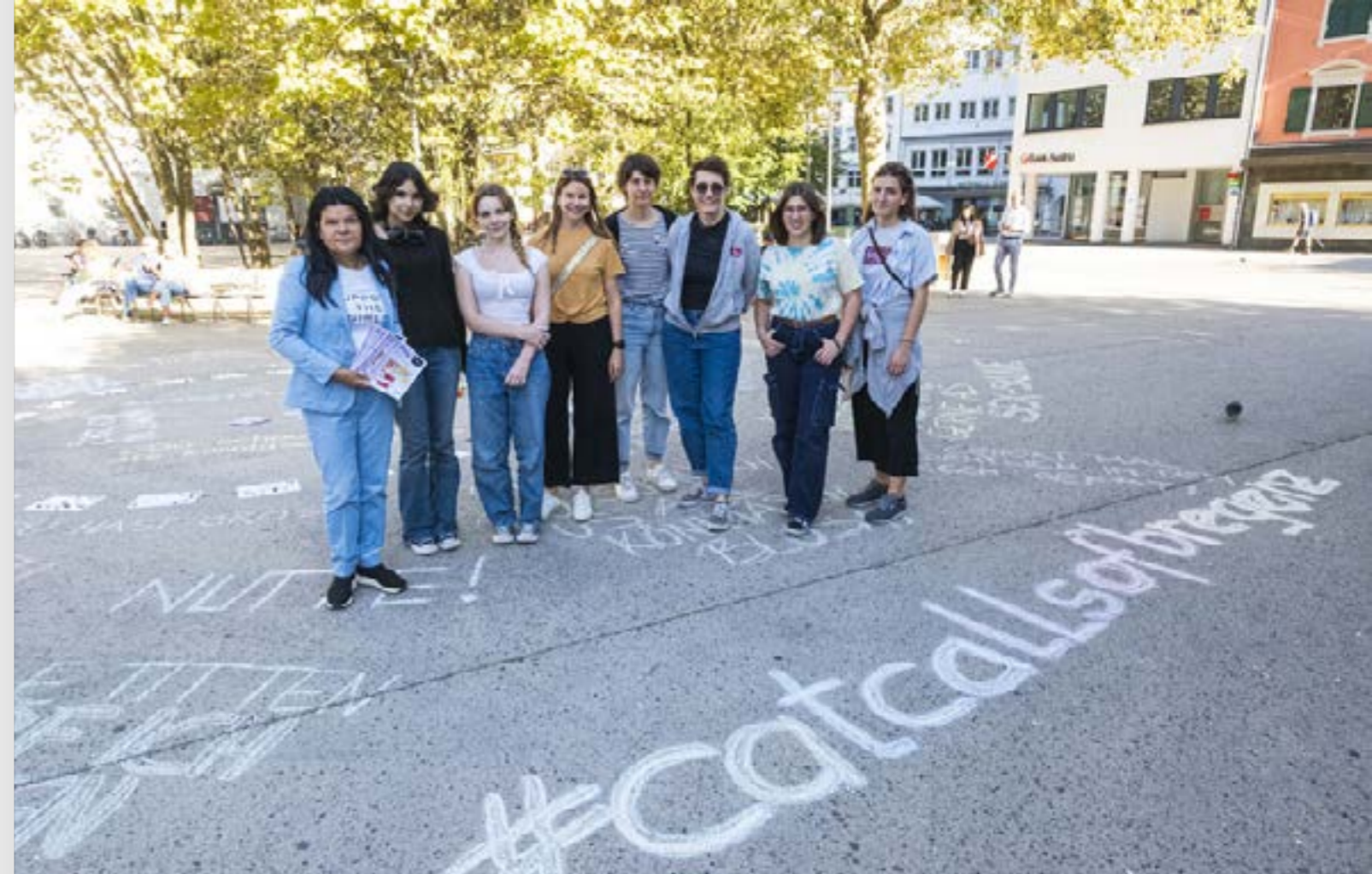
Die sogenannten „Catcalls“ – also Beleidigungen, Anmachen oder Begrapschen im öffentlichen Raum – sind keine Einzelercheinung, sondern vor allem für Mädchen und Frauen tagtägliche Realität.