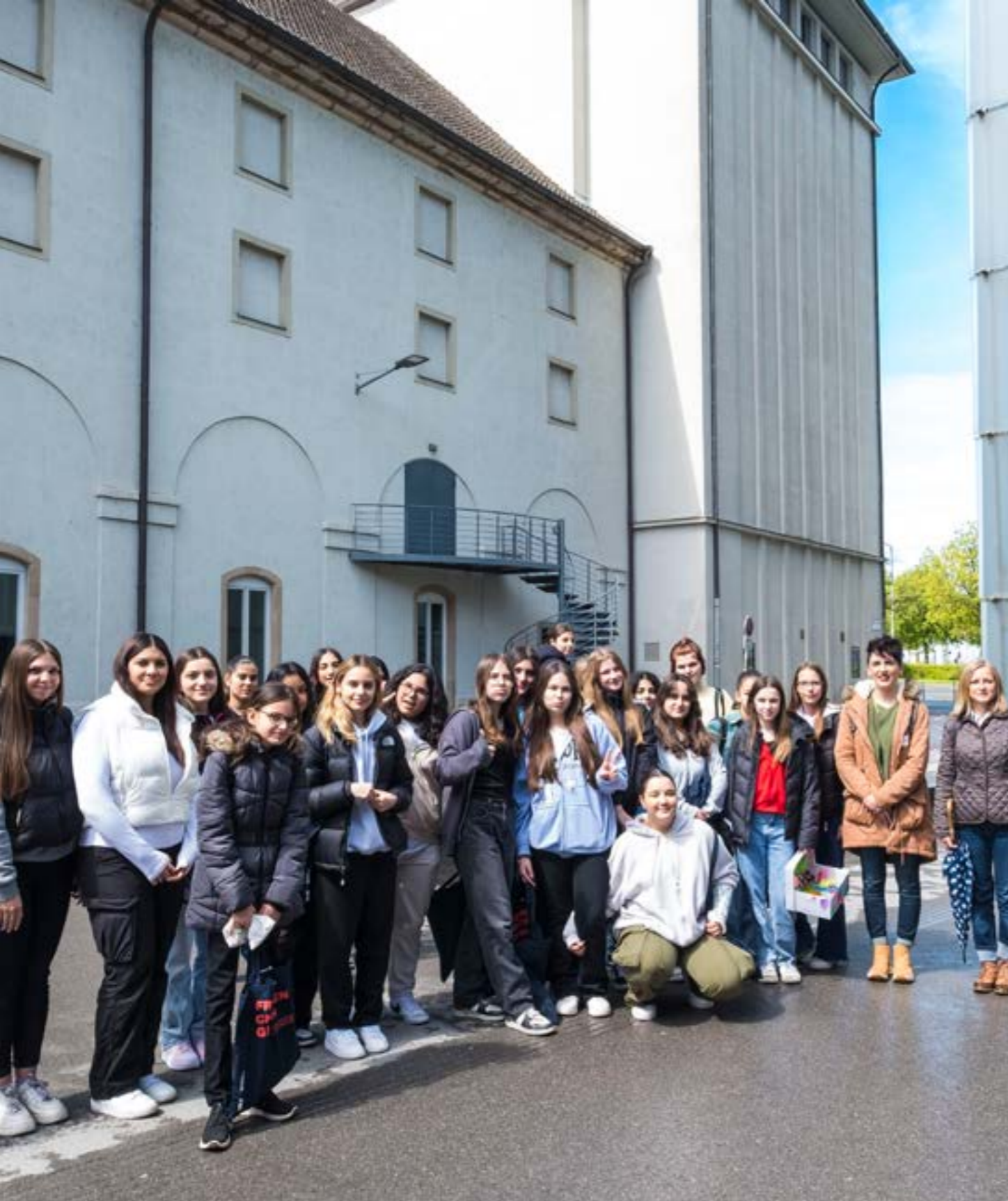
Beim Girls Day konnten Mädchen der Bregenzer Mittelschulen Rieden und Schendlingen Kompetenzen für technische Bereiche, die oft von Männern dominiert sind, entdecken oder festigen.