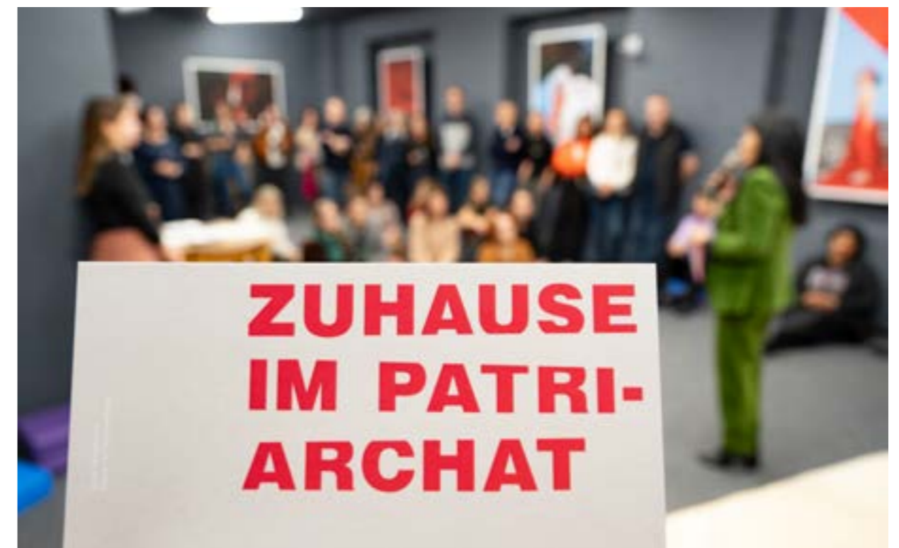
Die Kunstaussstellung verdeutlichte: Femizide sind nichts Privates, sie sind ein gesellschaftliches Problem. Diese Morde sind keine Familien- oder Beziehungsdramen, sondern Resultat patriarchaler (Denk-)Strukturen.