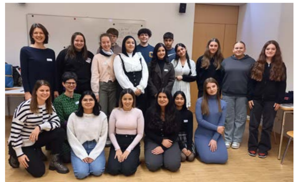
Im Jahresprojekt „Für mich!“ mit femail wurde an der Schule für Sozialbetreuungsberufe ein Workshop zu den Themen Finanzen, Verhandeln und Kommunikation in der Partnerschaft abgehalten.