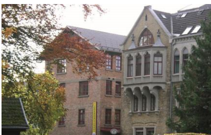
16 Jugend & Familiengästehaus | Mehrerauerstraße 5

Eigenbewirtung für Vereine möglich Miete EUR 290,- Kontakt Karlheinz Wehinger , T 05574/414-218