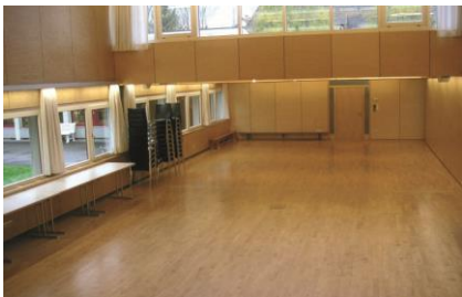
23 Pfarramt St. Gebhard | Wuhrwaldstraße 24