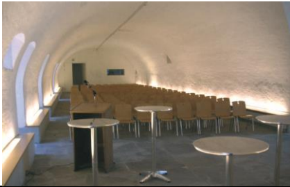
17 Kloster Mehrerau - Aula Bernadi | Mehrerauerstraße 68