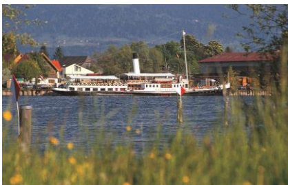
24 Raddampfer Hohentwiel | Anton-Schneider-Straße 1