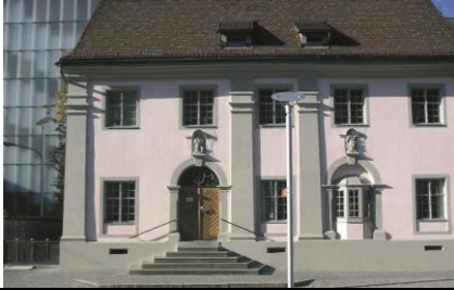
05 Gasthof Kornmesser | Kornmarktstraße 5