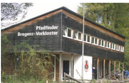
20 Pfadfinderheim Vorkloster | Schöllerteig