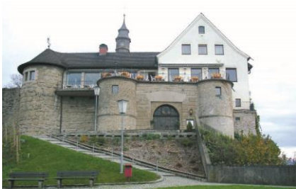
02 Burgrestaurant Gebhardsberg | Gebhardsberg

Fixe regelmäßige Termine können vereinbart werden Eigenbewirtung möglich. Sonstiges: Rauchverbot Miete: gestaffelt, siehe Website Kontakt Mag. Ursula Hillbrand , T 0676/3738717, ursula.hillbrand@salonhosting.net info@bregenzersalon.eu www.bregenzersalon.at