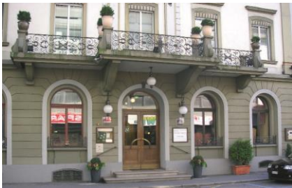
14 Hotel Weisses Kreuz | Römerstraße 5

Fixe regelmäßige Termine können vereinbart werden Miete EUR nach Anfrage Kontakt T 05574/4990