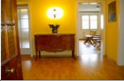
01 Bregenz Salon | Anton-Schneider-Strasse 11, 1. Stock