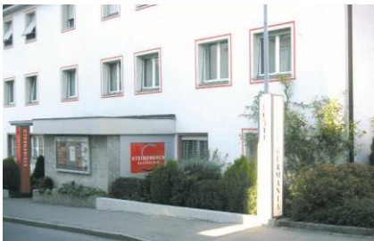
10 Hotel Germania | Am Steinebach 9