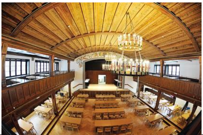
08 Gösserbräu Bregenz | Anton-Schneider-Straße 1

Teeküche für Eigenbewirtung vorhanden Fixe regelmäßige Termine können vereinbart werden. Keine externen Geburtstagsfeiern! Miete EUR nach Anfrage Kontakt: Christine Helbock, T 0676/848144310, christine.helbock@stiftung-liebenau.at