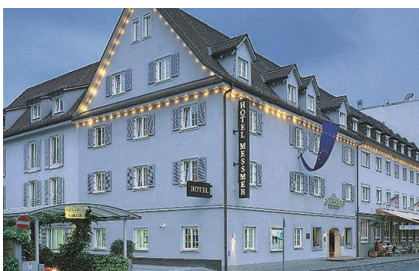
12 Hotel Messmer | Kornmarktstraße 16