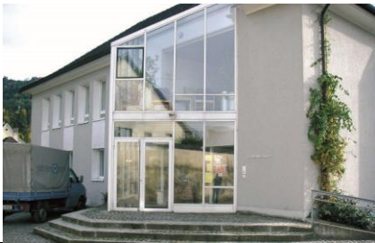
22 Pfarramt St. Gallus | Kapuzinergasse 6