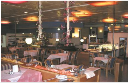
9 GWL-Café-Restaurant | Römerstraße 2, GWL