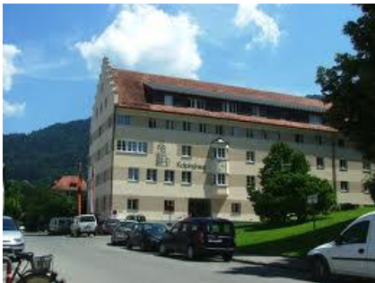
18 Kolpinghaus Bregenz | Kolpingplatz 9

Kontakt Klosterkeller Mehrerau , T 05574/86770, klosterkeller@mehrerau.at