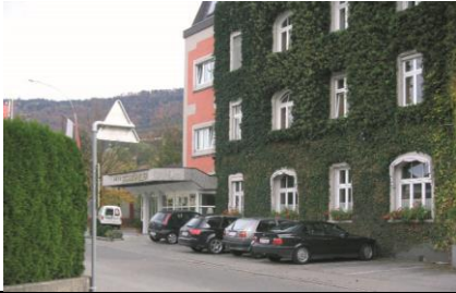
13 Hotel Schwärzler | Landstraße 4