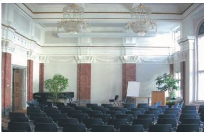
15 Hypo-Landtagssaal | Hypo-Passage 1

Fixe regelmäßige Termine können vereinbart werden Miete EUR nach Anfrage Kontakt Andrea Kinz , t 05574/49880 , hotelweisseskreuz@kinz.at