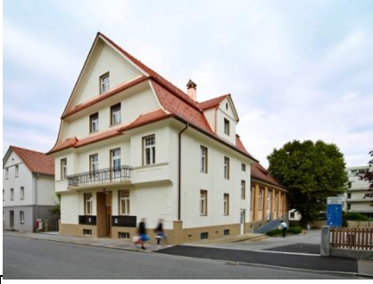
21 Pfarramt Herz Jesu, Austriahaus | Belruptstraße 21