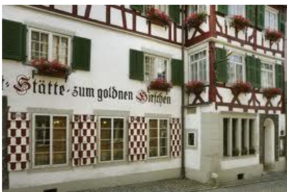
04 Gaststätte zum goldenen Hirschen | Kirchstraße 8

Teeküche für Eigenbewirtung vorhanden Vermietung am Wochenende Mietpreis auf Anfrage Kontakt: Stadtteilbüro Schendlingen , T 05574 / 410-1669, www.bregenz.at