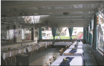
06 Gasthof-Hotel Lamm | Mehrerauerstraße 51

Miete EUR keine Fixe regelmäßige Termine können vereinbart werden Kontakt T 05574/548540