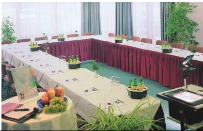
11 Hotel Mercure | Platz der Wiener Symphoniker 2